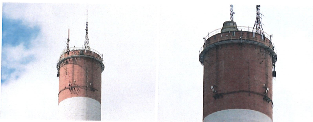
Widok instalacji radiokomunikacyjnej Stacja Netia KIELW001 - KIELM00045 Kielce, ul. Hubalczyków 30.